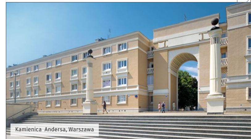
Kamienica Andersa, Warszawa