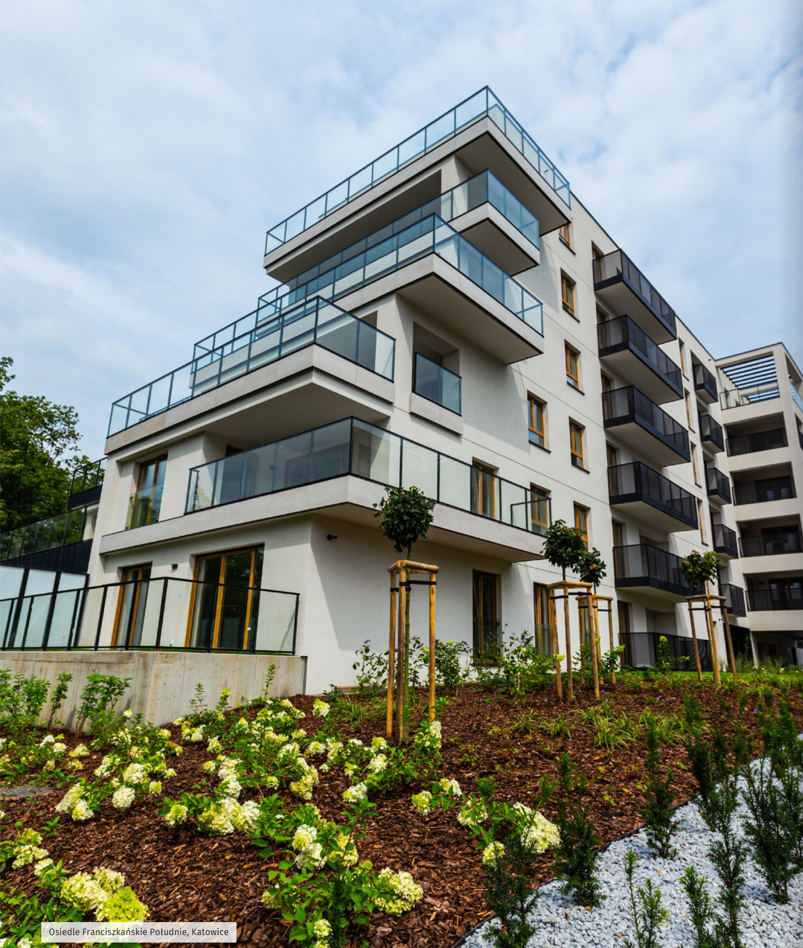
Osiedle Franciszkańskie Południe, Katowice