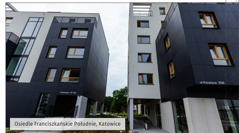
Osiedle Franciszkańskie Południe, Katowice